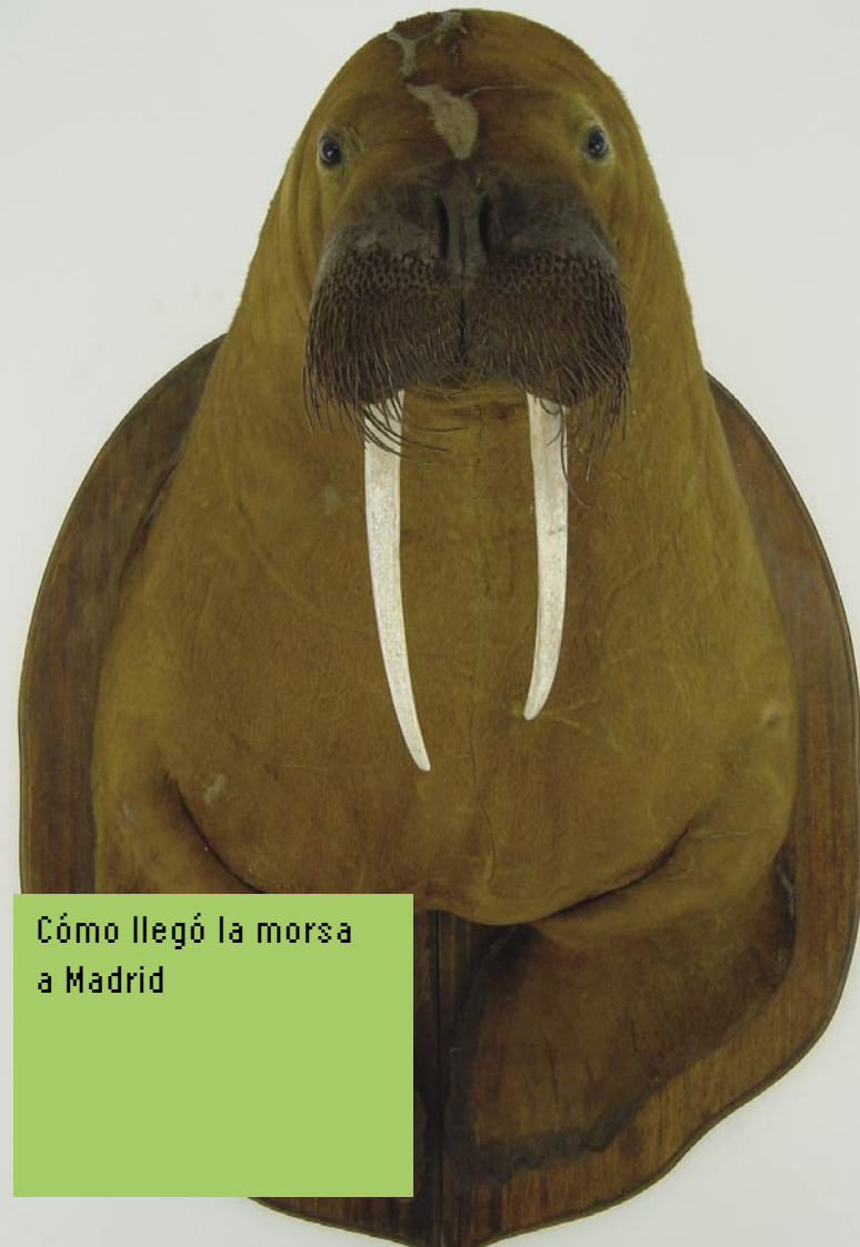
Cómo llegó la morsa a Madrid

Sa01, En familia: Medio Ambiente a escena. Los cuentos y representaciones para niños de los fines de semana de febrero girarán en torno a nuestro planeta, los árboles, la basura y los monstruos autóctonos en peligro de extinción. Lu03, Cómo llegó la morsa a Madrid es una instalación de Gerda Steiner y Jörg Lenzlinger que se centra en una morsa disecada del Museo de Ciencias Naturales. Esta muestra se realiza con motivo de la presencia del arte suizo en ARCO 2003. Ju13, Jornadas de Violencia de Género. Dos días de debate y reflexión sobre uno de los problemas actuales más complejos. Sa15, Teatro de autor. La Casa Encendida inicia su programación de teatro con cuatro funciones de la obra Adiós a todos , de Luis García-Araus.