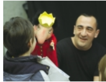
Cursos de animación socioeducativa Del 07.07.03 al 23.07.03

07.07 Curso de animación socioeducativa. Teatro, creación, el juego y la improvisación teatral se convierten en recurso educativo. 07.07 Volad, volad. Taller de aves de nuestra ciudad. Nuestras aves son el introductor ideal para fomentar actitudes de interés y de respeto por el medio ambiente entre nuestros menores. 08.07 Inéditos 2003. Tres proyectos expositivos de arte emergente. 08.07 Exposición Bienes comunes en conflicto. El control del agua dulce, la tierra, los océanos, la atmósfera y la biodiversidad se encuentra en el centro de los conflictos sociales de este mundo. 09.07 Propuestas escénicas. En julio y agosto, la tarde noche de los miércoles y los jueves, La Casa Encendida acoge propuestas escénicas diversas e insólitas.