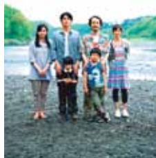
De tal padre, tal hijo , de Hirokazu Koreeda

Un arquitecto volcado en el trabajo y obsesionado con el éxito vive con su esposa y su hijo de seis años. De pronto, una llamada del hospital en el que nació su hijo lo cambiará todo.