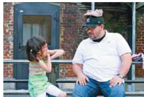
A cielo abierto, de Mariana Otero