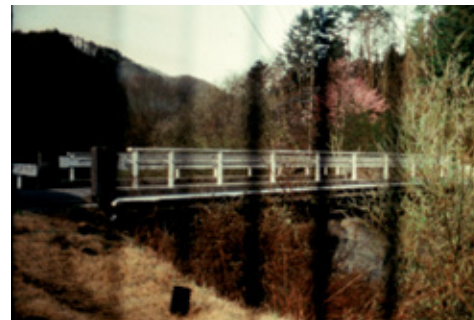
Ten Mornings Ten Evenings and One Horizon, de Tomonari Nishikawa

"El Brujo", de Loudgi Beltrame. Perú/Francia, 2016. 17'. DCP. Sin diálogos