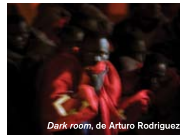
Dark room, de Arturo Rodriguez