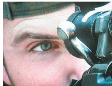
Festival de Cine y Derechos Humanos