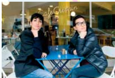
Malena Pichot y Charo López

Malena Pichot alcanzó el éxito mundial con los vídeos de La loca de mierda , cápsulas de humor online donde parodiaba y dramatizaba las situaciones de patetismo y despecho que provocan las rupturas sentimentales. Tras el éxito mundial de su personaje, protagonizó y escribió Cualca , su spin off , Por ahora y la miniserie Jorge . Le acompaña Charo López , actriz, improvisadora y comedianta, que actúa en el programa Por ahora y colabora regularmente en sketches dirigidos por Malena Pichot.