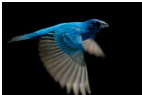
The Messenger , de Su Rynard