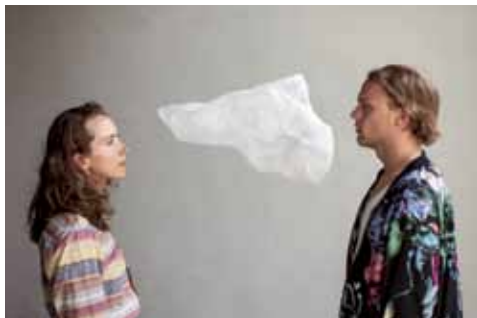
Idiots © Chrisander Brun

AADK Spain es un plataforma artística internacional que desarrolla proyectos de investigación y creación contemporánea. Una de las principales vías de desarrollo de estos proyectos es a través del programa de residencias artísticas en el Centro Negra (Blanca, Murcia). En esta sesión se presentarán dos obras surgidas de este programa.