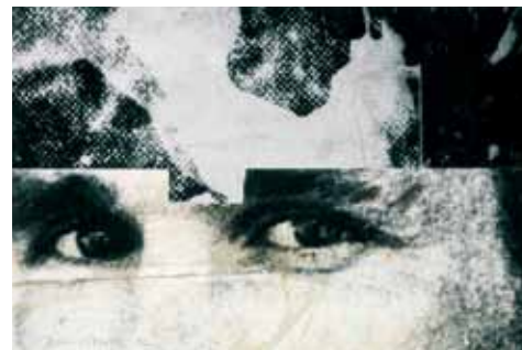
Morada sonora , 1992 © Dario Villalba

En esta sesión titulada Mentes desordenadas abordaremos el tema de la enfermedad mental, un estigma para el que la padece. A veces temido, a veces motivo de escarnio y siempre apartado, condenado a la marginalidad. No les hacemos caso, no les escuchamos, pensamos que están fuera de lógica y de la razón. ¿Y si les escuchamos por una vez?