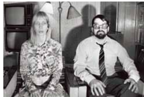
Disco and Atomic War , de Jaak Kilmi y Kiur Aarma

El ciclo de cine “Off the Wall” presenta una selección de películas realizadas por una generación de directores nacidos al otro lado del telón de acero desde mediados de los años setenta. Su niñez y adolescencia transcurrieron durante los últimos estertores del sistema soviético y, desde la distancia del tiempo y la proximidad de lo vivido, cuestionan cómo una sociedad miraba o se imaginaba a la otra, poniéndonos ante un espejo inimaginable. En octubre presentamos las tres últimas películas del ciclo.