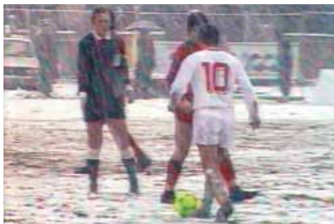
The Second Game , de Corneliu Porumboiu

En 1988, un año antes de que todo cambiara en Ru- manía, tuvo lugar en Bucarest un partido de fútbol de máxima rivalidad entre el Dinamo y el Steaua, en un estadio cubierto por la nieve. El árbitro del partido fue el padre del director de la película. Ambos se reúnen 25 años después para verlo de nuevo y comentarlo frente al espectador: ¿y si el árbitro hubiera cedido a la presión y favorecido a un equipo?, ¿y si la cámara hubiese mostrado un altercado en el campo?, ¿y si el partido se hubiese jugado un año más tarde?