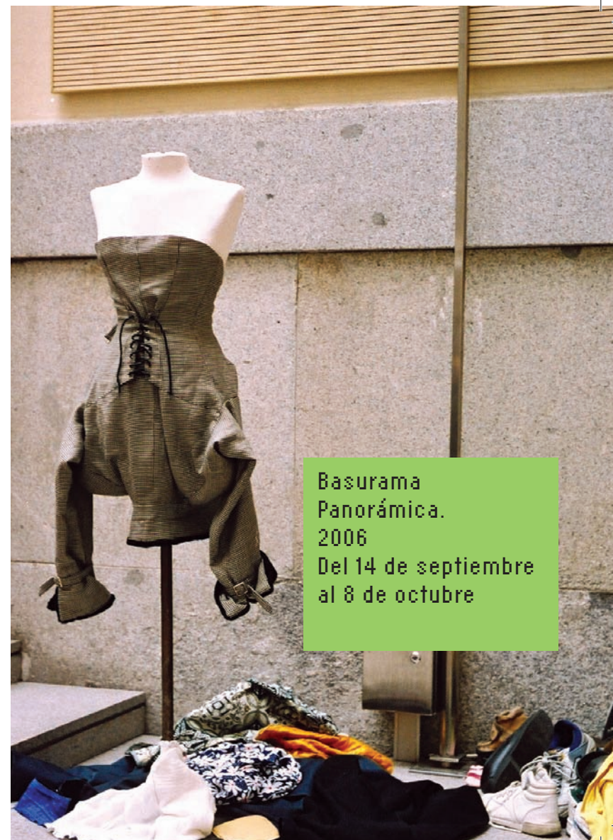
Basurama Panorámica. 2006 Del 14 de septiembre al 8 de octubre