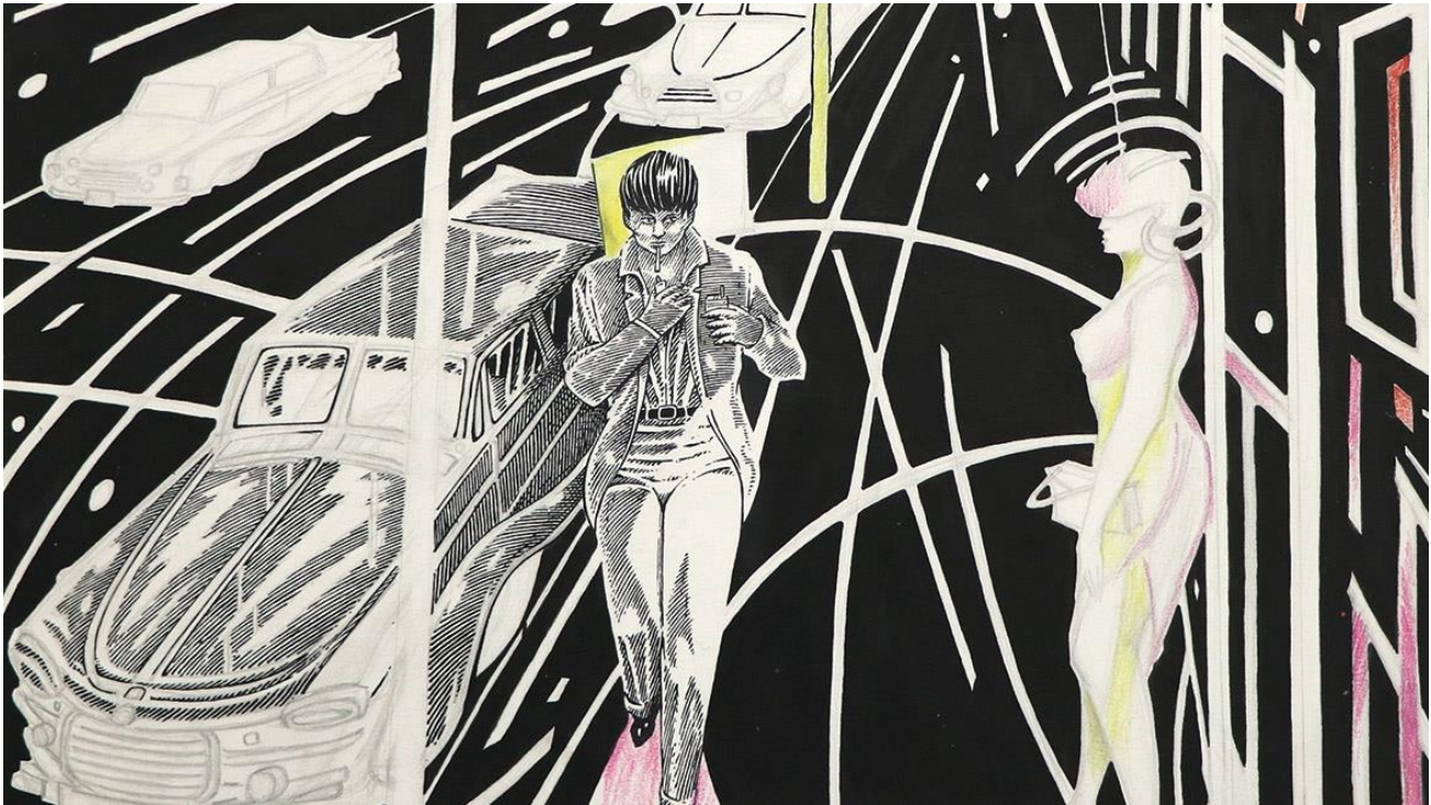
El Tacón Cubano

Del 31 de mayo al 22 de septiembre de 2019