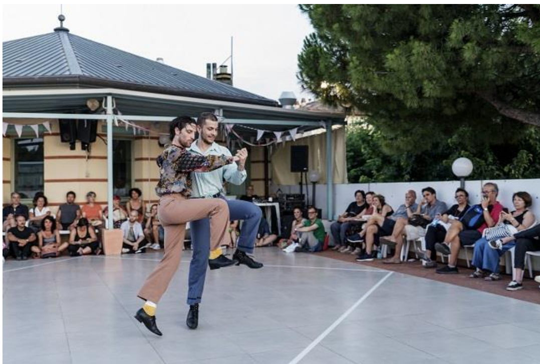
Save the last dance for me , de Alessandro Siarroni.