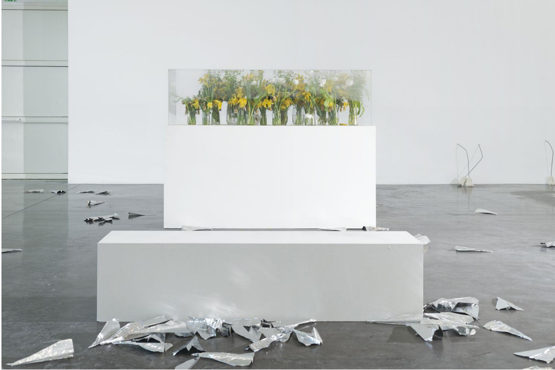
Jesse Darling. Crevé (2019). Triangle France - Astérides, Friche la Belle de Mai, Marsella.

La obra de Jesse Darling abarca distintos formatos como la instalación, video, texto, sonido y performance. A través de estos, aborda la falibilidad, adaptabilidad y vulnerabilidad de los seres vivos, la sociedad y las tecnologías.